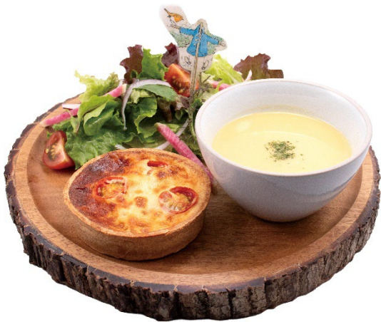
マグレガーおじさんの夏の菜園風キッシュプレート