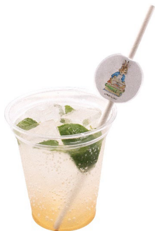
エルダーフラワーソーダ