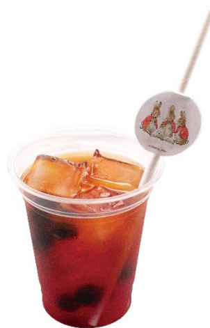
3姉妹のベリーティー