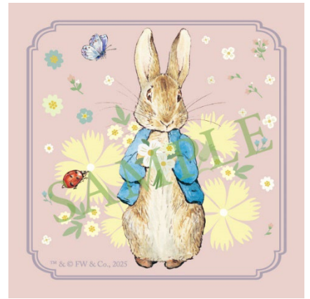
公式オリジナルステッカー