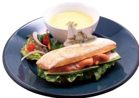
ジェレミー・フィッシャー™のサーモンサンド