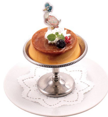
ジマイマのカスタードプリン