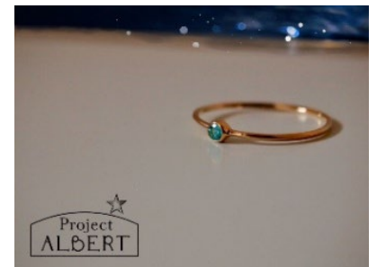
Project ALBERT パライバトルマリン リング