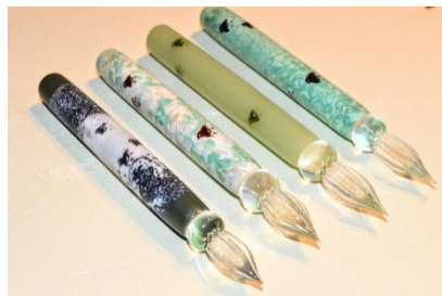
がび工房 ガラスペン各種