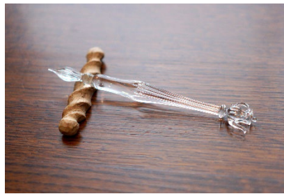
岡崎百貨店オリジナルガラスペン TEA POT (Seed Lampwork)