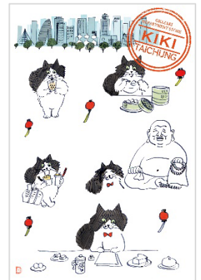
岡崎百貨店オリジナルポストカード 旅 KIKI 台中編