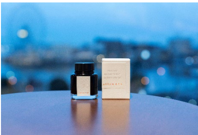
岡崎百貨店オリジナルインク ASSAM RED