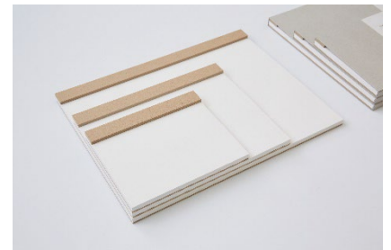
ITO BINDERY ドローイングパッド A5 ホワイト