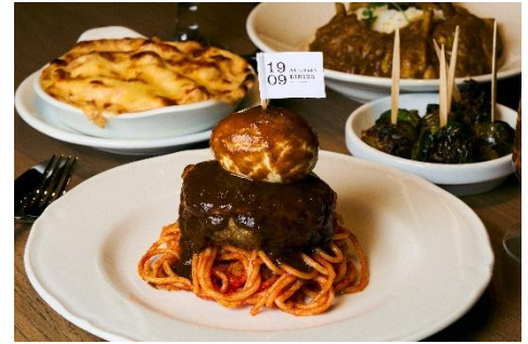
ジューシーハンバーグ&ナポリタン