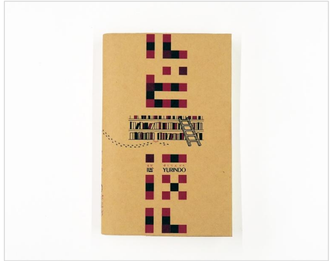
「ルビ財団」×「有隣堂しか知らない世界」オリジナルデザインのブックカバー（裏表）