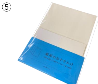
紙屋のおすそわけ セット