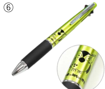
「R.B.ブッコロー」イラスト入り ジェットストリーム4&1