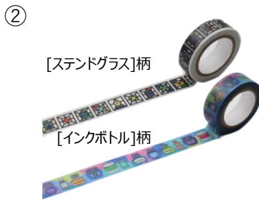
[スタンドグラス]柄