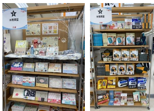
「文具女子博2020」有隣堂ブースの様子