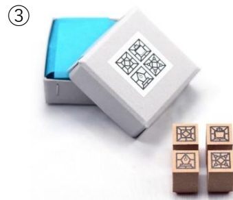
「スタンドグラス」柄ゴム印セット