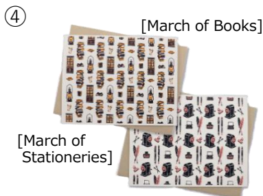
[March of Books]