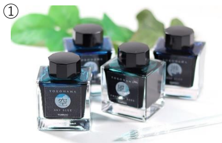
有隣堂限定オリジナル色インク 「空」「海」「港」「風」の4色