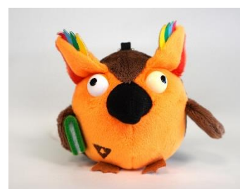
R.B. ブッコローキーチェーン付きぬいぐるみ

チャンネル登録者数10万人突破を記念して、2021年11月にはチャンネルMCキャラクター「R.B.ブッコローのキーチェーン付きぬいぐるみ」を発売しました。＜初回限定版＞の1200個は、ECサイト、実店舗とも発売日に即日完売。12月11日には＜通常版＞も発売しました。