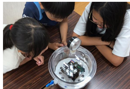
真空実験 イメージ