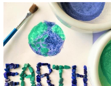
地球のめり絵 イメージ