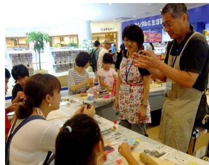
流木ねんどアート教室 イメージ