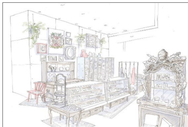
「岡崎百貨店」イメージ

ヨーロッパの小さい蚤の市をイメージした売場となり、整然と分類されている従来の文房具売場と違い、商品との偶然の出会いを作ります。文房具のほか、ガラスペン、アクセサリ、お菓子、1点もののヴィンテージ雑貨など、岡崎が偏愛する約500点の商品を展開します。