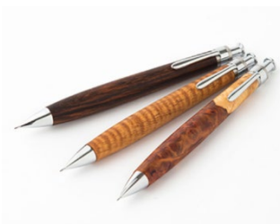
木軸式シャープペンシル