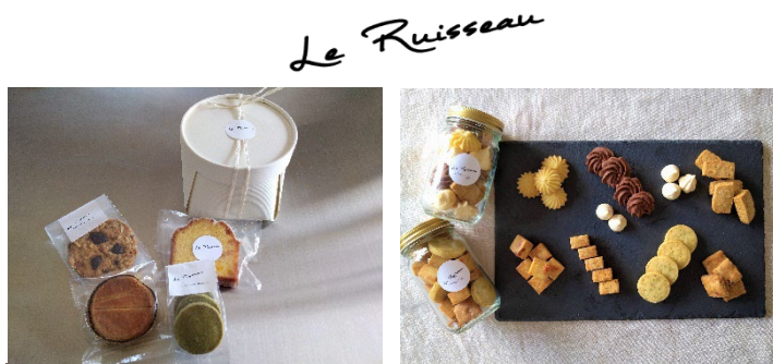
「ルリュイソー」の焼菓子

厳選した素材で、季節の果物を使ったタルトや焼菓子を作っています。店舗を持たず、横浜や仙台等のイベントと通販でのみ販売をしていますが、イベントでは午前中で完売してしまうほど人気です。店舗での定期的な販売は、岡崎百貨店が初めてです。オートミールが好きな岡崎のために、オートミールクッキーをラインナップに入れました。