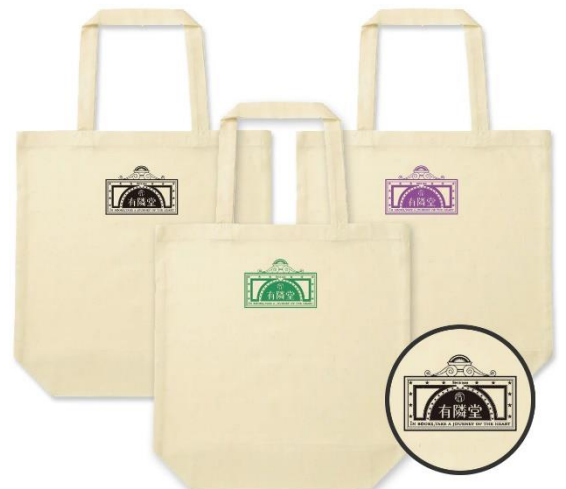
有隣堂ルミネ横浜店オリジナルトートバッグ

レジ脇には「美味書店」と名付けた食品コーナーを設置。おせんべいやお茶など読書のおともに最適な食品がずらりと並ぶ。