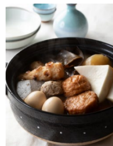
山口家のおでん ※画像はイメージです。

3ヵ月連続イベントの第1弾となる、「有隣堂ららぽーと豊洲店」のイベントは「日曜午後のほろ酔いトーク」と題し、山口恵以子先生が、「本所おけら長屋」シリーズで知られる作家 畠山健二先生をゲストに迎え、トークショーを開催致します。おでんの試食は、山口恵以子先生オリジナルレシピの「山口家のおでん」と紀文食品の「ご当地風おでん」をお召し上がりいただけます。2021年11月に、「ヒビヤセントラルマーケット」にて、「婚活食堂」に登場するレシピの再現メニューを提供するイベントを実施致しましたが、山口恵以子先生のオリジナルレシピのおでんを提供するのは今回が初となります。また、日本酒の試飲は、小西酒造株式会社(兵庫県伊丹市)と楯の川酒造株式会社(山形県酒田市)の2つの酒蔵から提供されたものを、それぞれの酒造の解説付でお召し上がりいただけます。