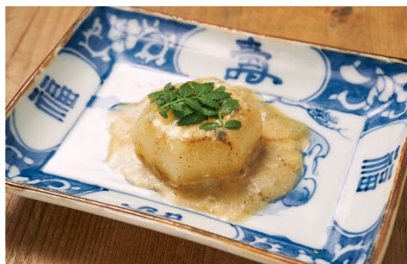
⑥ カブのブルーチーズソテー