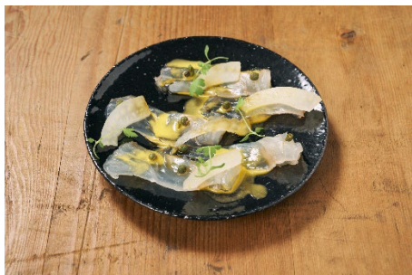
① 平目のカルパッチョ 温州みかん山椒ソース