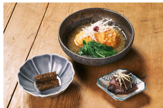
イベント後も提供する料理3品