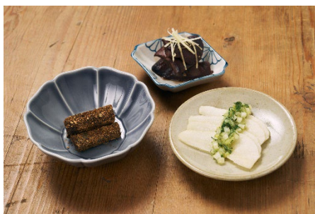
② ラ・フランスのセロリジンジャー柚子ソースがけ ③ ゴボウのオイル煮 ④ 鶏レバーの赤ワイン煮