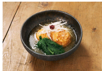
⑤ 魚河岸あげ®の みぞれ仕立て