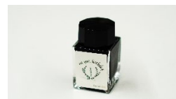
「代官山蔦屋書店限定 オリジナルインク」