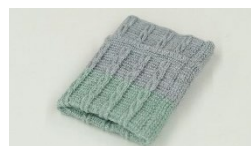
「蔦屋書店限定本のセーター」