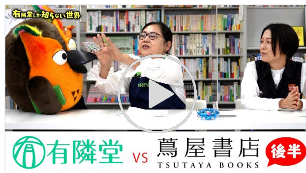
動画【友達にあげるなら】クリスマスプレゼント対決 後編