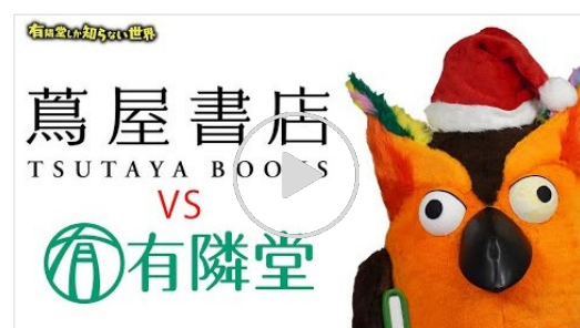
動画【逸品vs逸品】クリスマスプレゼント対決