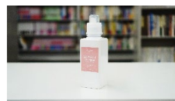
「シルク&ウール デイタージェント」