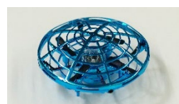
「フライングライトUFO」