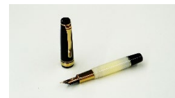
「代官山蔦屋書店限定 オリジナル万年筆」