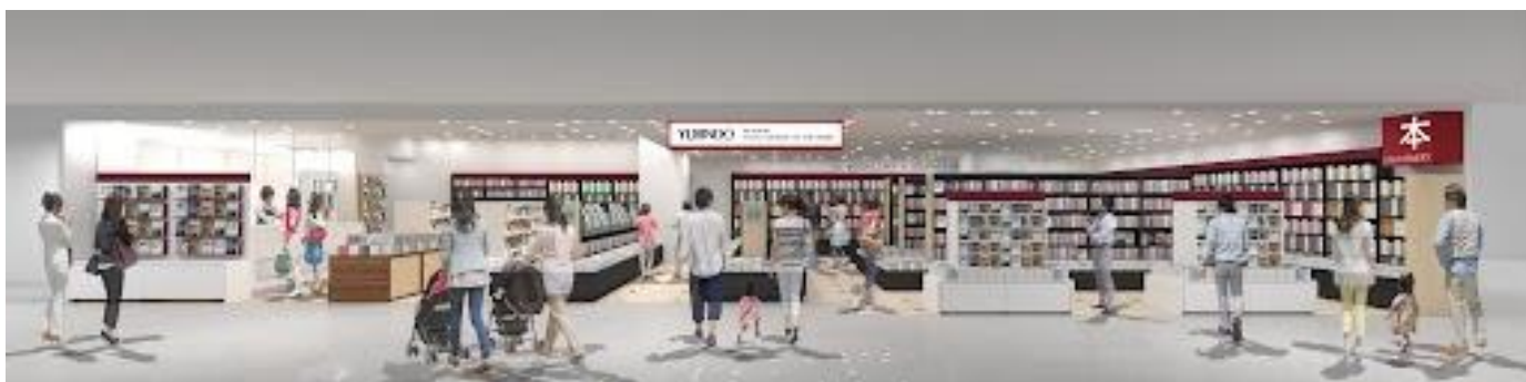
ラスカ小田原3階に移転オープンする「有隣堂ラスカ小田原店」(イメージ)

株式会社有隣堂(本社：神奈川県横浜市 代表取締役社長：松信健太郎)は、2023年4月1日(土)、「有隣堂ラスカ小田原店」をこれまで営業してきたラスカ小田原5階からJR小田原駅改札フロアの3階に移転オープンを行います。移転後は、改札フロア直結という利便性を活かし、「日常的に通いたくなる書店」をコンセプトに、ご利用のお客様のニーズに応じてまいります。