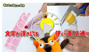
動画【神発想】 個性強すぎ文具の世界