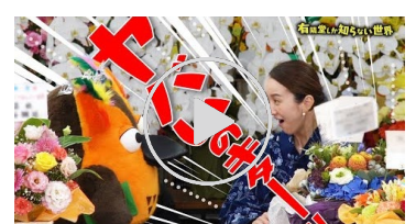
動画【“あの人”から贈り物】 チャンネル3周年(番外編・後編)