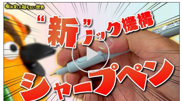
動画【でも使える】個性強すぎ文具の世界（その2）