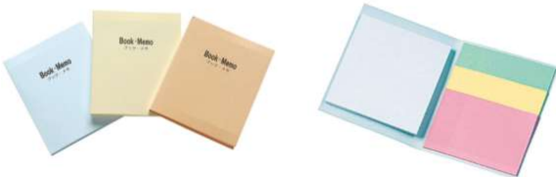
ブックメモイメージ(実際のデザインと異なります。サイズ: 95×78×5mm)