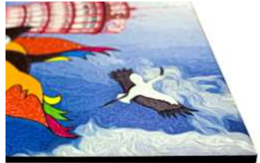
有隣堂 神戸阪急店限定デザイン

PENON(ペノン)は、環境に配慮した「エシカル文具」という新たなジャンルを開拓し、誰にでも手の届く価格で長く使うことができる、サステナブルな商品を開発しています。