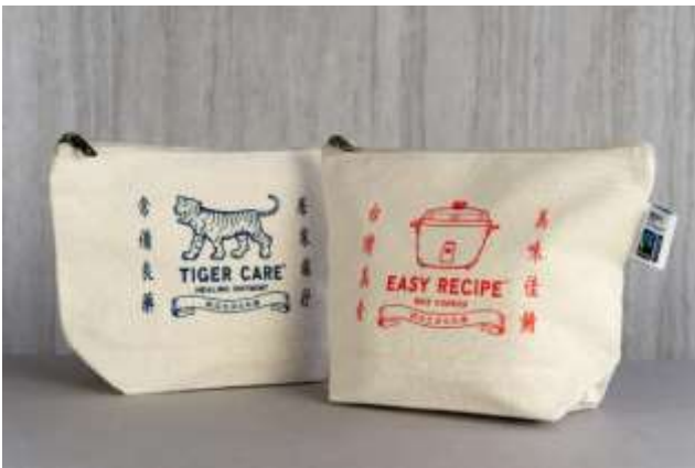
完成イメージ(実際の商品とは異なります)