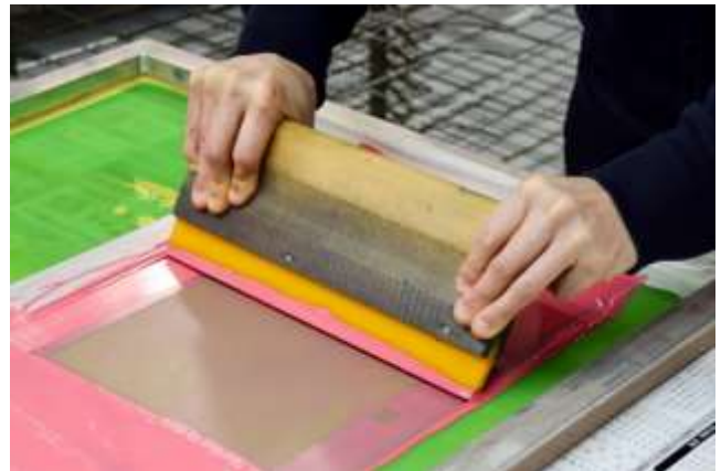
手刷り体験のイメージ