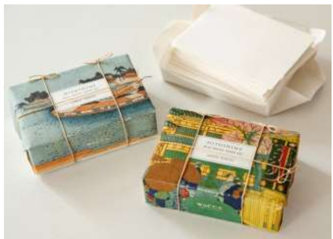
商品外装イメージ