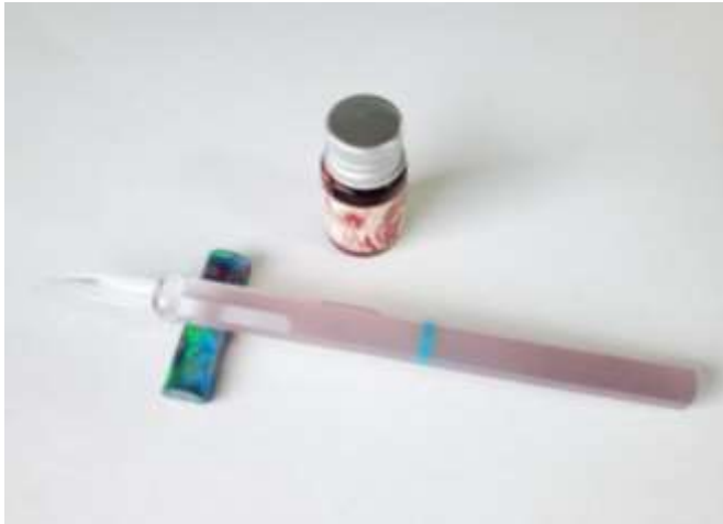
甲州水晶貴石ペン