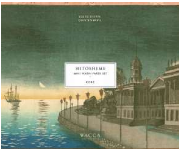
有隣堂 神戸阪急店限定パッケージイメージ