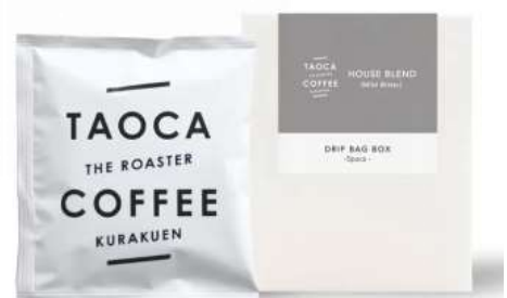
イメージ画像(実際の商品とは異なります)