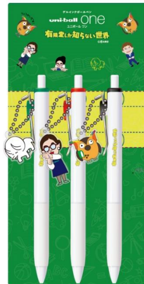
※パッケージイメージ図