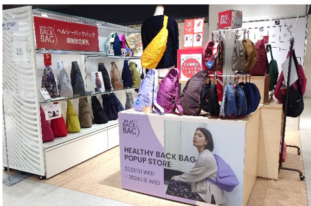
「HEALTHY BACK BAG」POP-UPストア