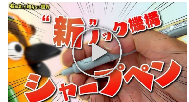
【でも使える】個性強すぎ文具の世界(その2)