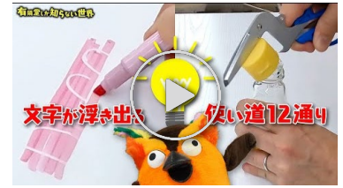
動画【神発想】個性強すぎ文具の世界