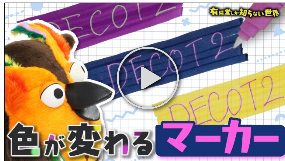
動画【超アイデア5選】個性強すぎ文具の世界（その