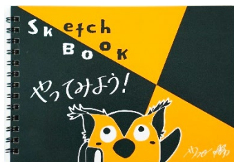
限定版 R.B.ブッコロー 図案スケッチブック B6