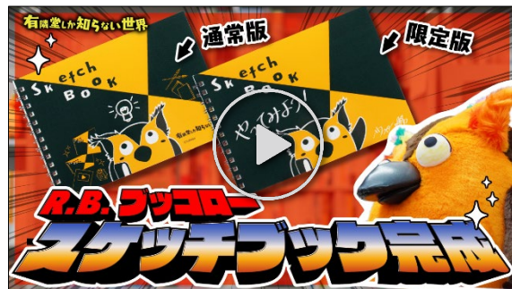
動画【動画の最後に超サプライズ】ブッコロースケッチブック発売