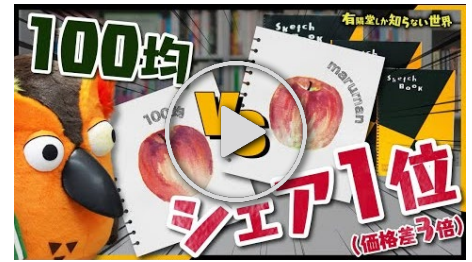
動画【描き比べてみた】スケッチブックの世界