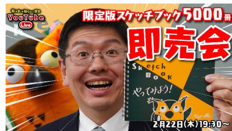
生配信【生配信中に完売できるか】 限定版ブッコロースケッチブック即売会