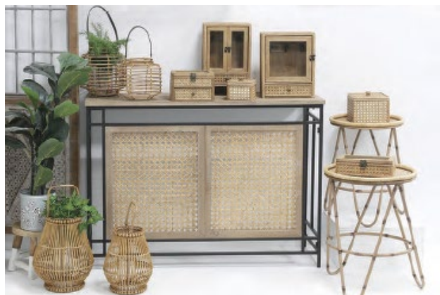
「SPICE of Life」商品イメージ