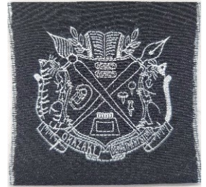
岡崎百貨店 オリジナルタグ