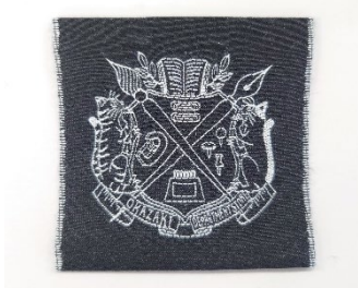
⑤-1 ジャガード織りのエンブレムタグ