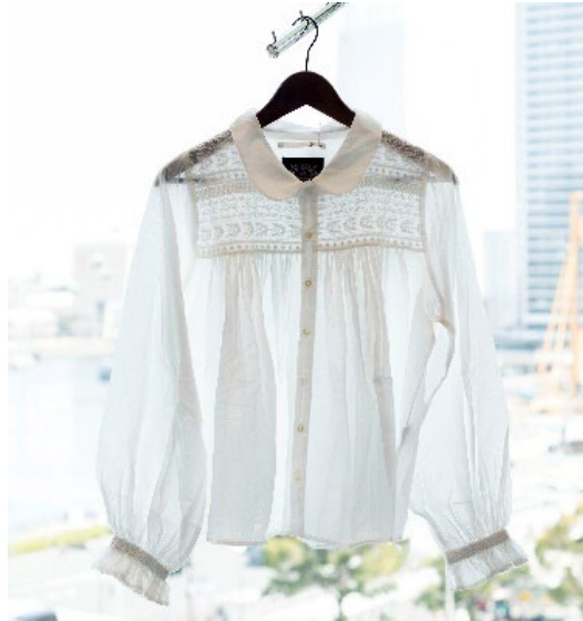
岡崎百貨店 オリジナルブラウス