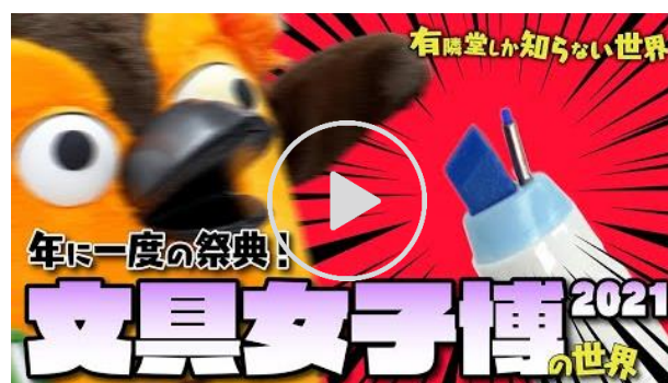
動画【使えるヤツばかり】文具女子博 2021 の世界