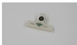
「プラクリップグロー」