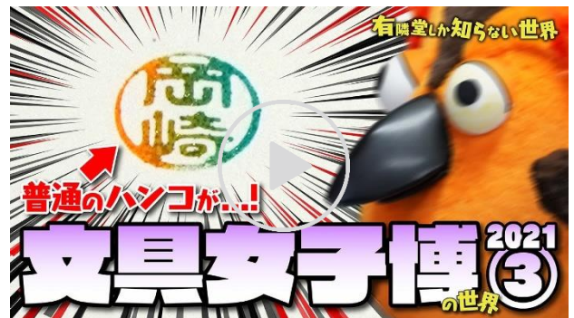
動画【3度目の正直】文具女子博 2021 の世界③