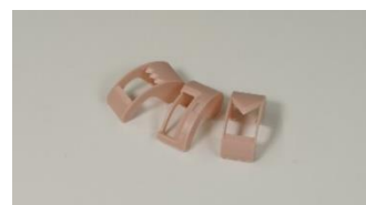
「マステリボンボン」