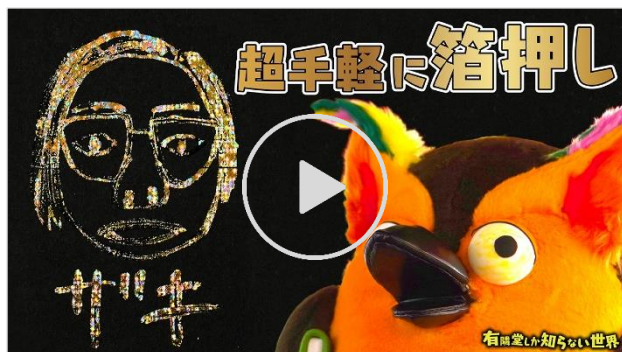
動画【最新アイテム4選】文具女子博2022の世界