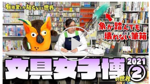
動画【超技術から毎日遊べるものまで】文具女子博 2021 の世界②