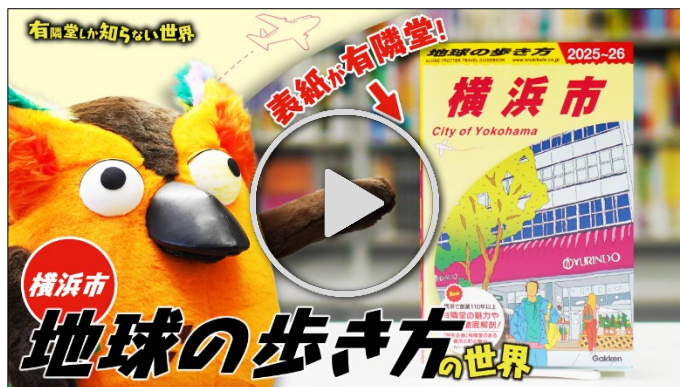
動画【最新刊】地球の歩き方（横浜市版）の世界