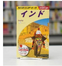
地球の歩き方 インド 2024～2025