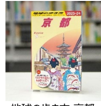
地球の歩き方 京都 2023～2024