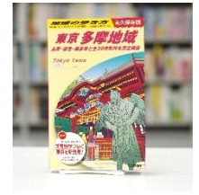
地球の歩き方 東京 多摩地域