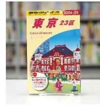
地球の歩き方 東京 23区 2024～2025