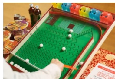
ピンボールゲーム

「彈珠臺(ピンボール)」や「高爾夫賓果(ゴルフビンゴ)」など、台湾の夜市で愛される『台湾夜市遊戯』が登場します。ゲームチャレンジに応じて景品もご用意しています。