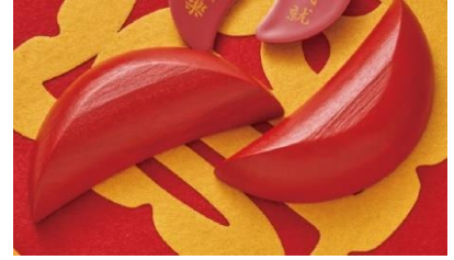
擲筊(ポアポエ)占いのイメージ

※擲筊(ポアポエ)とは、中国、台湾で親しまれている占いの1種です。三日月型に削った赤い木(紅木)や石で作られた杯 を使用し、これらを床に投げて落ちた状態で縁起を占います。