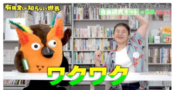
まさよ姐さん出演の様子