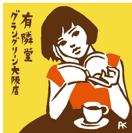
アジサカコウジ氏描き下ろしステッカー