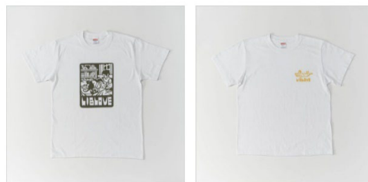
アジサカコウジ氏デザイン Tシャツ