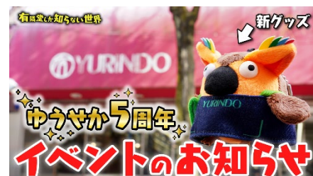
【1日店長します】“ゆうせか” 5周年イベントのお知らせ サムネイル

出演者：R.B.ブッコロー、阿部綾奈（有隣堂 社長室 デジタルクリエイティブチーム）