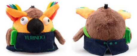
ブックローキーチェーン付ぬいぐるみ(エプロン)