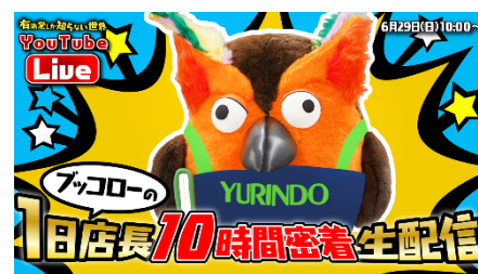
「ブッコロー1日店長！10時間密着生配信」 サムネイル

配信 URL： https://youtube.com/live/75dFYcnx-Bs