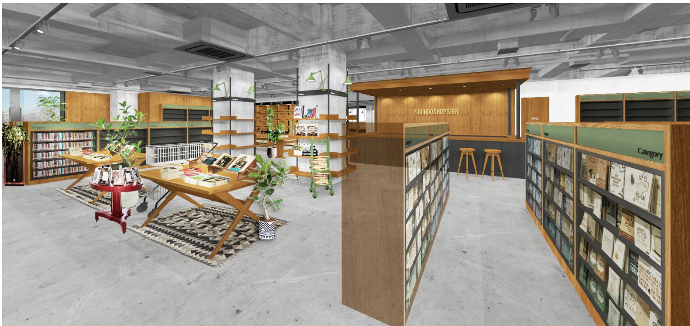
2F 書店売り場（イメージ）

本出店は、創業の地・横浜で培ってきた精神を受け継ぎながら、新たな体験価値を提供する取り組みとなります。書籍・マルシェ・コワーキング・カフェ・ギャラリーを融合させ、日常とイベントが共存する“開かれた文化拠点”を目指します。さらに、従来の書店像を進化させたブランドの挑戦として、人と本、そして街と文化をつなぐハブの役割を担い、関内から横浜の地域活性化と文化的なにぎわいの創出に貢献してまいります。